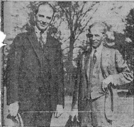
Esta foto, tomada en los jardines de la residencia de Henry Ford, en Dearborn, Michigan, muestra al famoso industrial acompañado del conocido experto financiero Owen D. Young. Ford es el de la derecha.