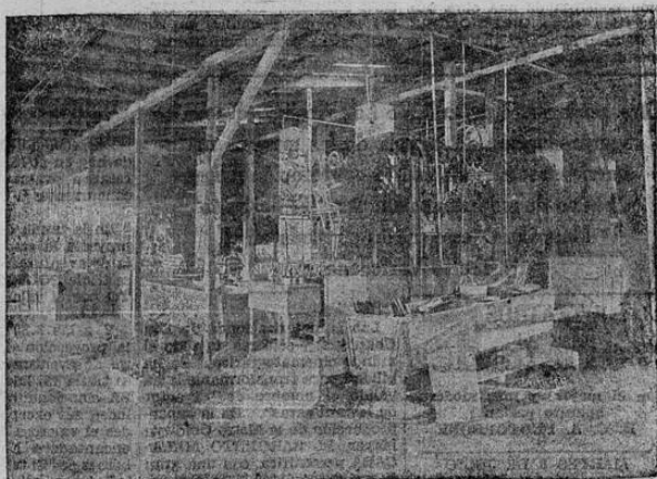
EN LA CASA DE COCCION PARA LA FABRICA-CION DE LA CERVEZA

Por escasez de espacio no pudimos dar ayer en nuestra primera crónica "Las Pequeñas Grandes Industrias de Costa Rica", los grabados que presentan dos aspectos diversos de la importancia de la Fábrica Traube.